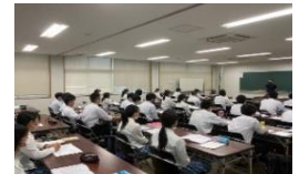
チャレンジセミナー風景（R4）